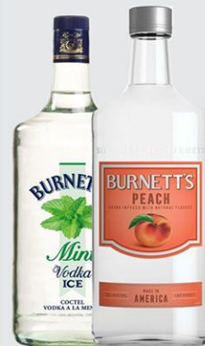
VODKA Burnett's x 1000cc