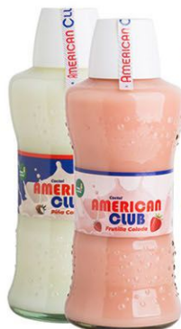
AMERICAN CLUB x 750cc Piña Colada (4041) Fritilla Colada (4042)