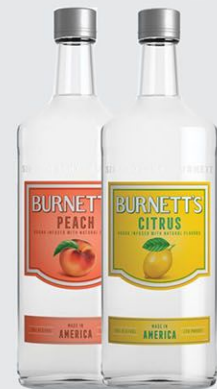
VODKA Burnett's x 750cc

Durazno (4070) Limón (4072) Manzana (4071)