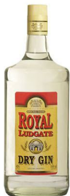
GIN ROYAL LUDGATE x 1000cc (4102)