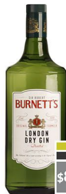
BURNETT'S x 1000cc Gin (4120)